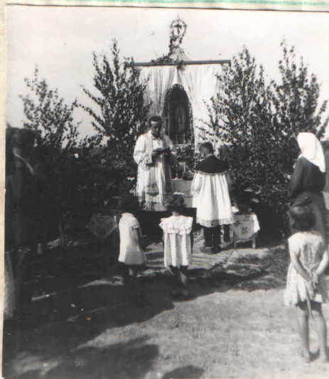
Poświęcenie pól w Krasnem rok 1960.