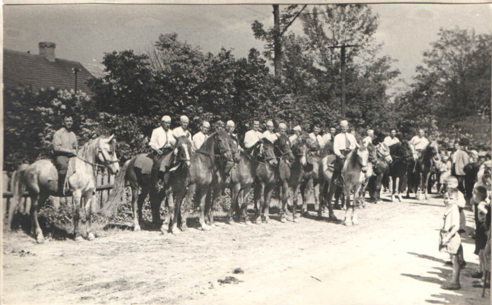
Bandiera konna oczekuje na przyjazd ks. Biskupa