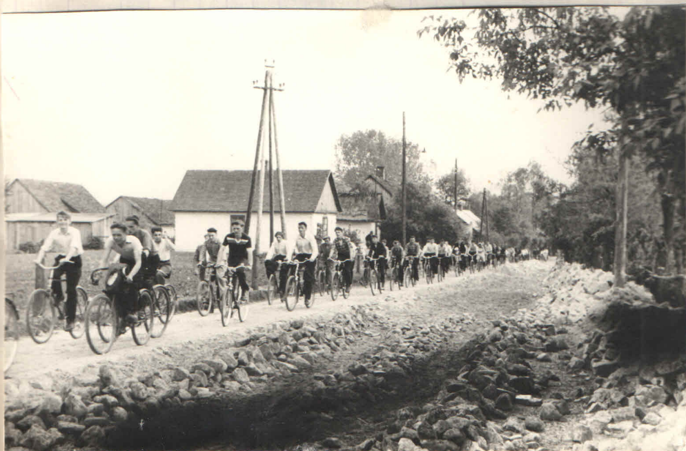
W powitaniu uczestniczą również roweryści i motocykliści.