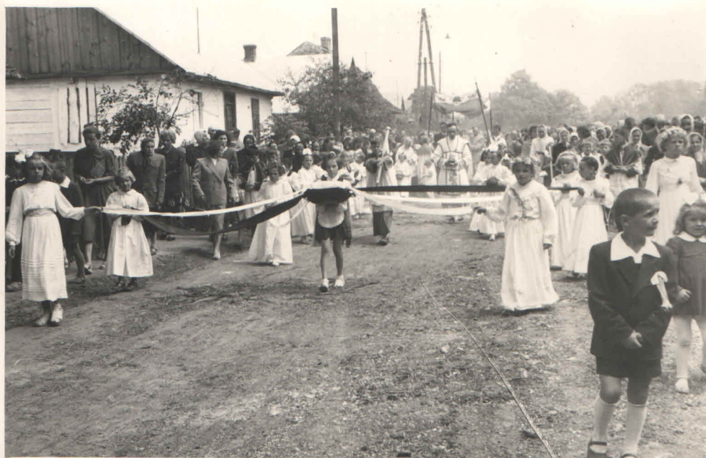
Procesja Bożego Ciała w Pawtowie - - rok 1959