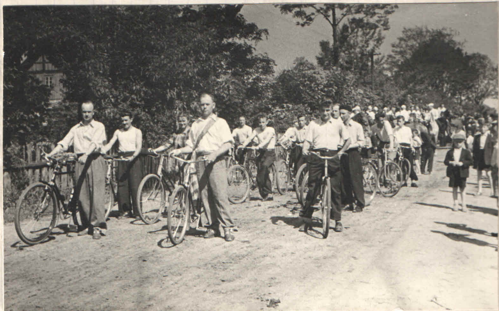
Wizytacja pasterska w Pawłowic - Zielone Świątki 1958 roku -